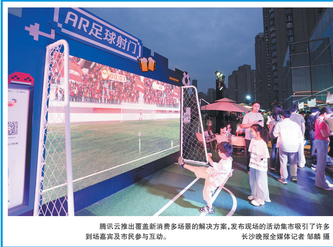
腾讯云推出覆盖新消费多场景的解决方案，发布现场的活动集市吸引了许多到场嘉宾及市民参与互动。

此次活动由市委宣传部(市文明办)、市教育局、市妇联、湖南湘江新区新时代文明实践中心主办，湖南湘江新区宣传部(文明办)、湖南湘江新区教育局、湖南湘江新区妇联、长沙市少年宫承办。