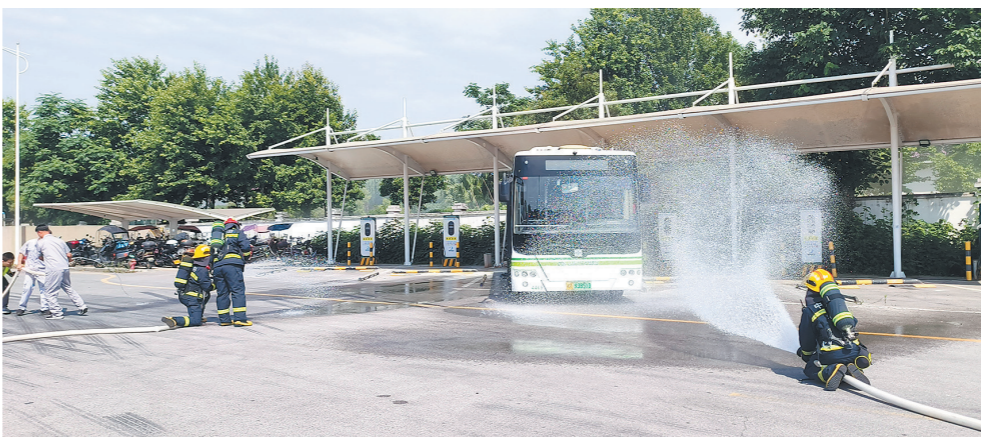
充电的公交车突然“起火”，消防紧急扑灭。长沙晚报全媒体记者 周小华 摄

“报告监控中心！公交车发生事故，有乘客受伤，后车追尾有人被困！”驾驶员第一时间按下一键报警按钮。随即，视频监控中心、运营调度中心、车队负责人、公安交警……一条横跨跨